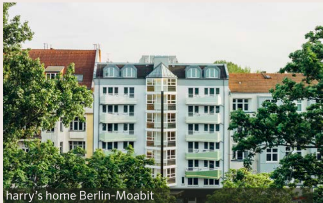
harry's home Berlin-Moabit