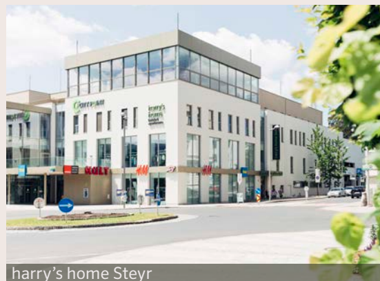
harry's home Steyr