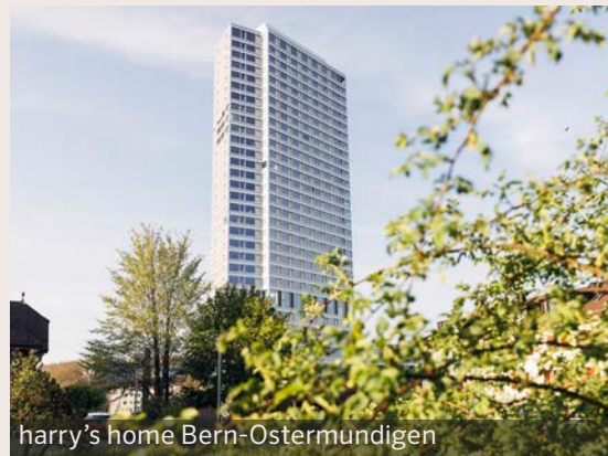
harry's home Bern-Ostermundigen