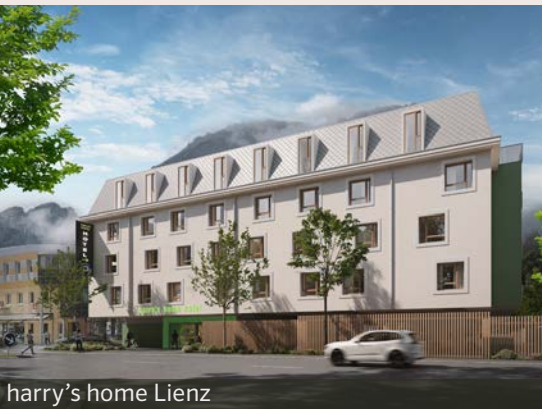
harry's home Lienz