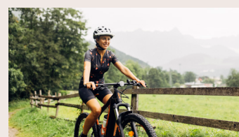
Beruf und Freizeit kombinieren