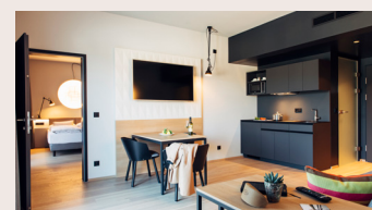
2 bedroom apartment 60-75 m 2 Doppelbett (trennbar) und/oder Queensize-Bett, Wohnzimmer mit Küche und Esstisch, erweiterbar um ein Doppelzimmer, Terrasse