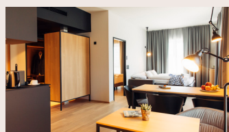
Family & Friends 40-50 m 2 Queensize-Bett, Küche, teils mit Balkon, Dusche/WC