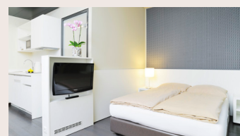
Studio Business ab 27 m 2 Queensizebett 160 x 200 cm Dusche/WC, Küche, im 1. Stock direkter Zugang zum Atrium, im 2. Stock mit Balkon zum Atrium