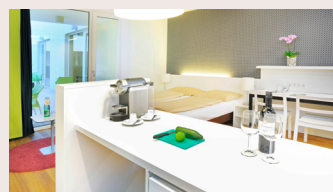
Studio Superior ab 32 m 2 Doppelbett (trennbar), Dusche oder Badewanne/WC, Küche, teilweise mit Atriumzugang