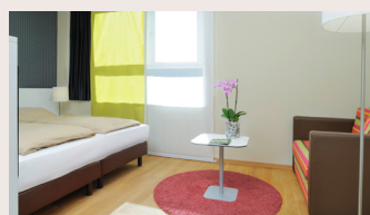
Standardzimmer ab 25 m 2 Doppelbett (trennbar), Dusche /WC