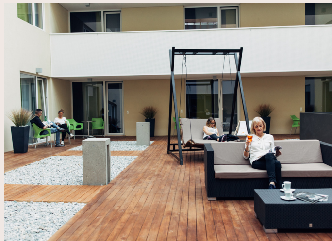
Atrium Der ideale Platz zum Entspannen