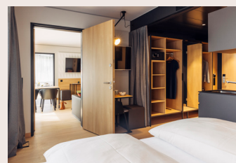
2 bedroom apartment ab 70m 2 Doppelbett (trennbar), Wohnzimmer mit Küche, Esttisch und große Couch, erweiterbar um ein Doppelzimmer, Dusche/WC teilweise Badewanne