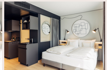
Studio ab 28m 2 Queensize-Bett, Kitchenette, Dusche/WC