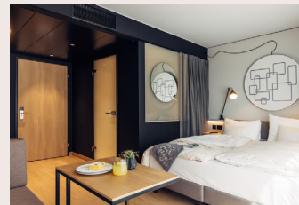
Standardzimmer ab 22m 2 Doppelbett, Sessel, Dusche/WC