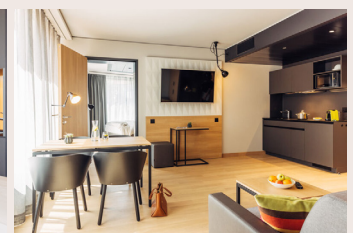
Apartment ab 36m 2 Doppelbett (trennbar), Kitchenette, Essbereich, mit Couch. Badewanne/WC's